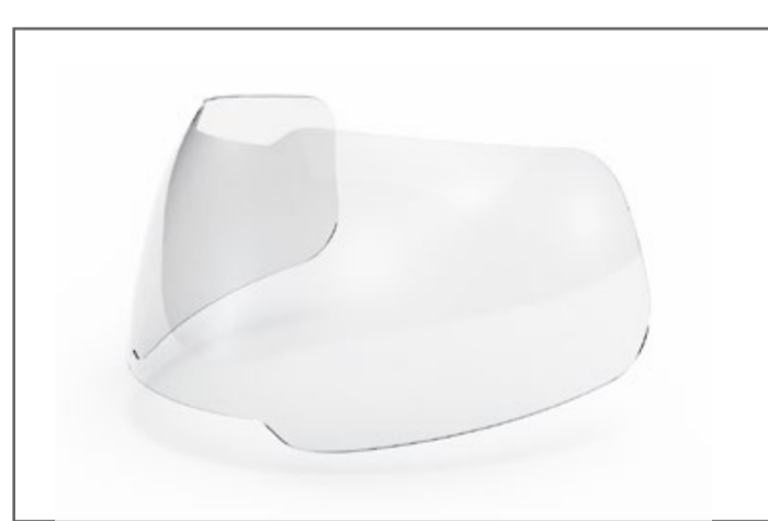
Protección en policarbonato