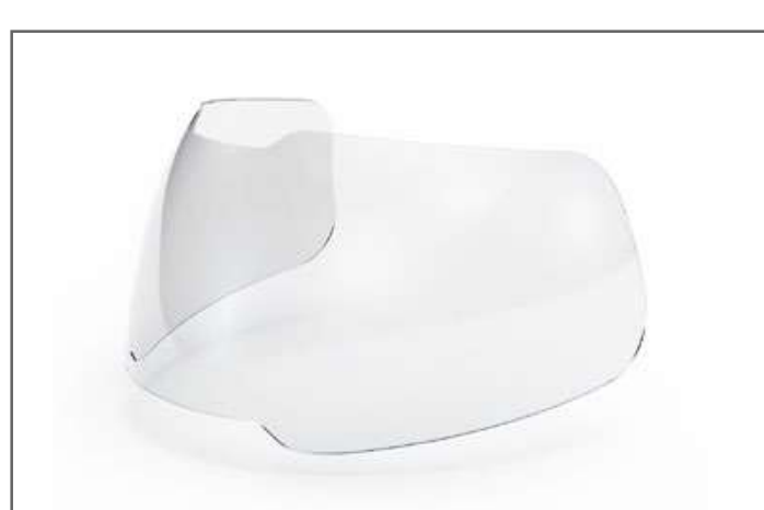
Protección en policarbonato